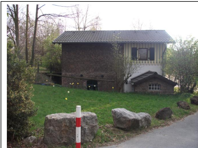
Die alte Brikettwaage heute: Dort wo der weiß verputzte Anbau steht, verlief vor 100 Jahren ein Gleis, auf dem die Loren gewogen wurden. In der linken Hälfte des Gebäudes waren Briketts aufgeschüttet, die zum Austarieren der Loren genutzt wurden.